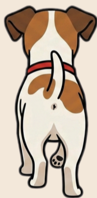
Van je af