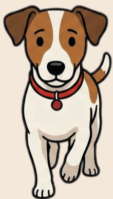
Naar je toe