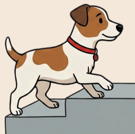
Een opstapje of trap nemen

Bang dat jouw hond in stilte pijn heeft? Leer observeren en loggen in de zorggids van Mantelbaasje! www.mantelbaasje.be