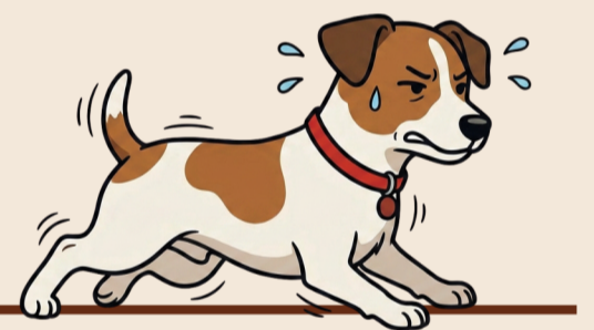
Opstaan na rust